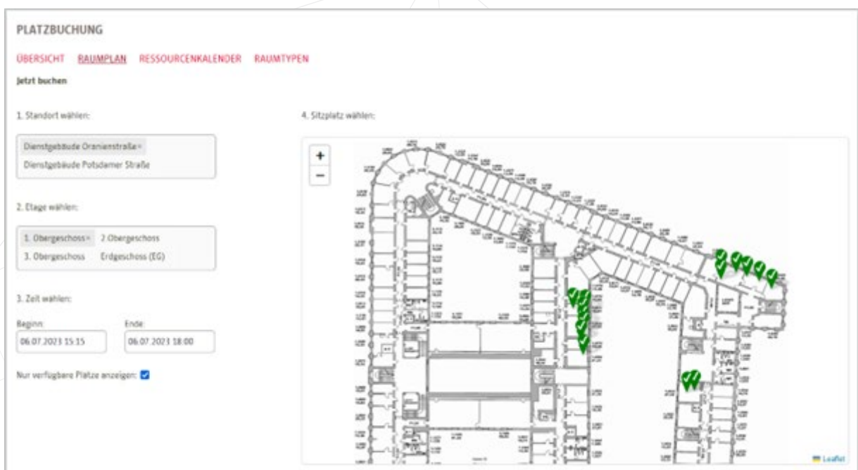
Abbildung 2: Buchungsansicht über Raumplan